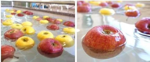
ぷっかりぶかぶか、華やかな香りに包まれる時間。

仙人の里デイサービスセンターのお風呂の魅力は、なんといってもその広さ！ おもいきり大の字で浮かんでも余る自慢の大浴場です。毎月26日を「風呂の日」と位置付けて、26日がある週（おおむね毎月第4週）は1週間まるごとドンドン「お風呂ウイーク」を開催。様々な薬湯・入浴イベントをお楽しみ頂けます。どこかに遠出したような温泉気分、いかがでしょうか♪