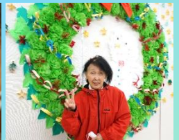
松ぼっくりツリーは、飾るビーズ玉の色や種類を自由に選ぶことで、ひとりひとりの「感性」を刺激。作業を通じて、手指の巧緻性の維持・向上を狙っています。