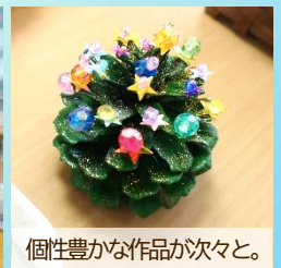
個性豊かな作品が次々と。