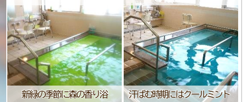
新緑の季節に森の香り浴 汗ばむ時期にはクールミント ひのき香る本格ごり湯 バラのエッセンスで華やかに