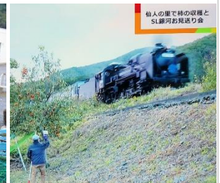
高枝切りバサミを操る姿、腰の入り方が違います。次々切って寄せられる柿の枝、あれ、今日は餅まきだった？ そんな盛り上がりの中、あっという間にカゴがいっぱい。そこへS L 銀河が登場！！