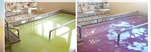
利用者様皆さんの「気持ちいい」が、私たち職員の“夢”。さあ次はどんなお風呂ウイークにしましょうか？ これまでのお風呂ウイークは、こんな感じです (-) 🍏