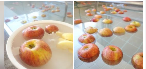
今回のりんごは、紫波のりんご園からの直送品でした☆